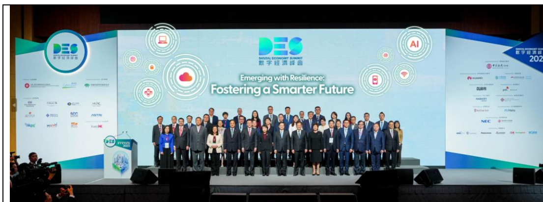
亞洲創新科技旗艦盛事 2023 数字经济峰会今日于香港会议展览中心揭开序幕。