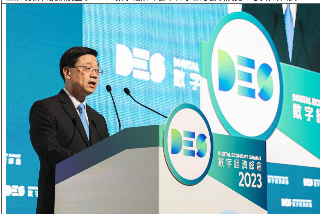
香港特别行政区行政长官李家超先生指大家必须拥抱数码革命带来前所未有的蜕变，增强竞争力，共创智慧未来。